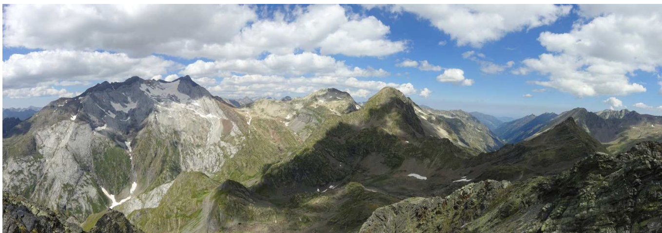
Panorama du Pouey Mourou

Et c'est le cœur léger que nous descendîmes le troisième jour (veille du retour à Bordeaux) vers le minibus en racontant nos anecdotes de la veille, du séjour, de Bayen, en projetant notre prochaine aventure bayennaise qui sera au moins autant mémorable.