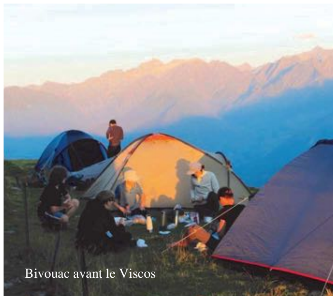
Bivouac avant le Viscos