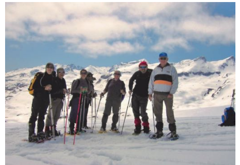
et de moins jeunes aussi...