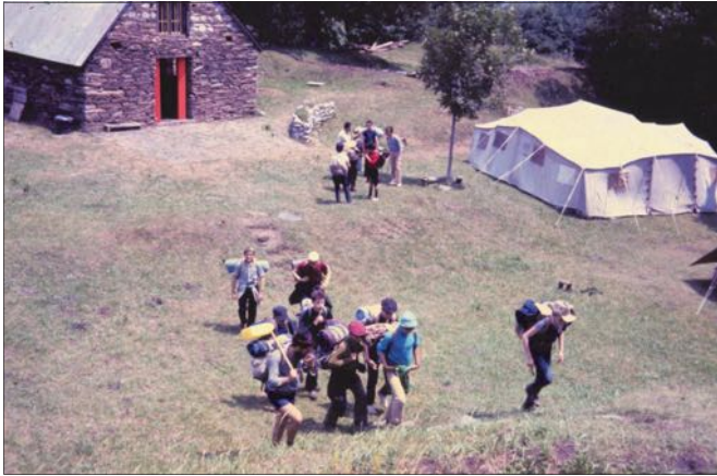
Juillet 1972 : Départ pour les Gloriettes