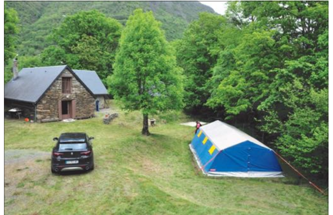
Juin 2022 : Avant les camps