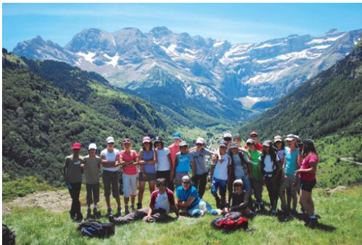
De jeunes randonnant en montagne,